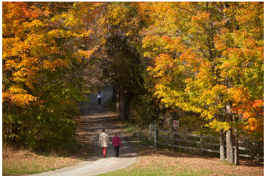
Enjoy the Mont Bellevue in the center of Sherbrooke during Fall

Exhibits and Sponsorships: Julien Biboud ( Julien.Biboud@mecanum.com )