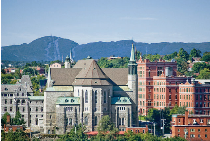
View of Mont-Orford from downtown Sherbrooke

Following its report in 2020, Acoustics Week in Canada 2021 will be held on October 6-8, in Sherbrooke, Québec.