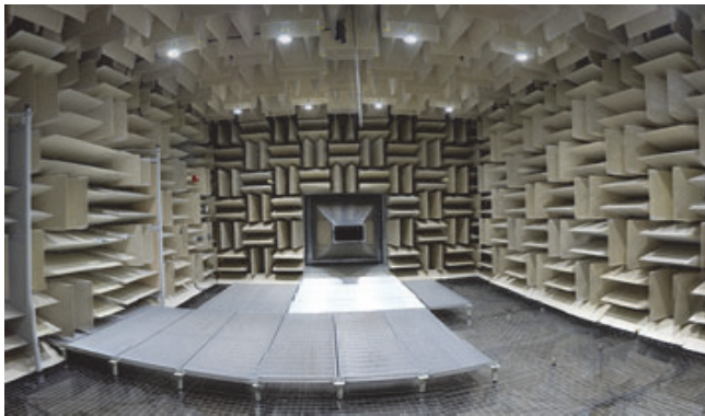
Anechoic room and wind-tunnel opening at GAUS

The tabletop exhibition facilitates in-person and hands-on interaction between suppliers and interested individuals. Companies and organizations that are interested in participating in the exhibition should contact the Exhibition and Sponsorship coordinator for an information package. Exhibitors are encouraged to book early for best selection.