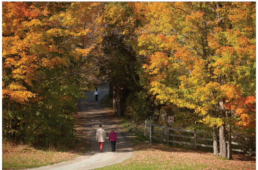
Enjoy the Mont Bellevue in the center of Sherbrooke during Fall