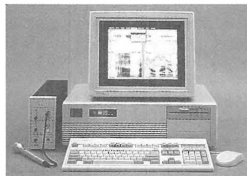
CSL with IBM compatible computer, monitor, microphone and mouse.

trigrams, formant trace, pitch extractions, power spectrum analysis, selective filtering, LPC analysis and many other analysis functions. In addition, the CSL can interface to many other programs providing users with added flexibility. Other features include: file management, graphics and numerical display, audio output and signal editing.